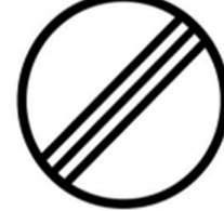
Hakem sahası sonu