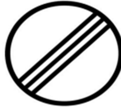
Özel Etap start sahası sonu