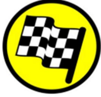
FF çizgisine 100m

Özel etap finiş bölümleri Yol Kitabı (Road Book) içerisinde belirtilecektir, bu alanlarda hakem bulundurulmayabilir.