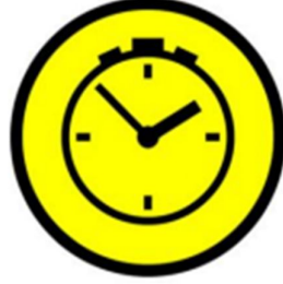
ZK Alanı Girişi

Zaman kontrol sahaları aşağıdaki levha ile tanımlanır