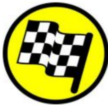
FF çizgisine 100m

Bu işlem mümkün olan en kısa sürede tamamlanmalı ve hakem kontrol sahasının dışına çıkılmalıdır. Özel finiş sahaları aşağıdaki levhalar ile tanımlanır. Bayraklar arasında araçlar geriye doğru sürülemez, bayraklar arasında aracını geriye süren yarışmacılar 10 saniye zaman cezası alacaklardır, Stop noktasını geçen yarışmacı ekip aracını park edecek ve hakem noktasını ekipten bir kişi yürüyerek dönerek kartını hakeme imzalatacaktır.