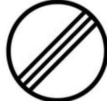
Hakem sahası sonu