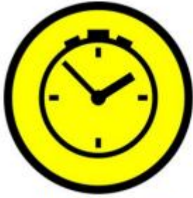
ZK Alanı Girişi

Zaman kontrol sahaları aşağıdaki levha ile tanımlanır