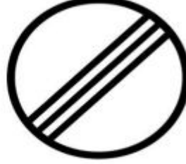
Özel Etap start sahası sonu