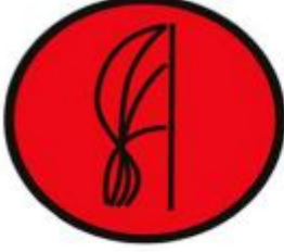
Özel Etap Start noktası

etap start alanları aşağıdaki levhalar ile tanımlanır.